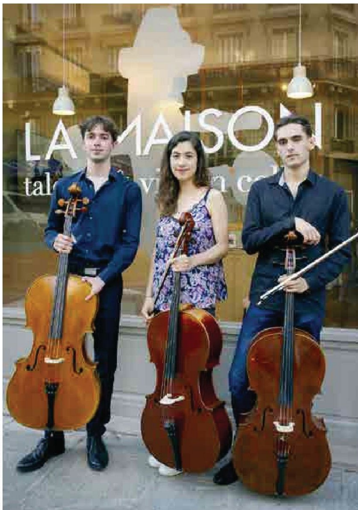
JP MILLOT/TALENTS ET VIOLONCELLES